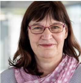
Anke Hofmann Service & Consulting