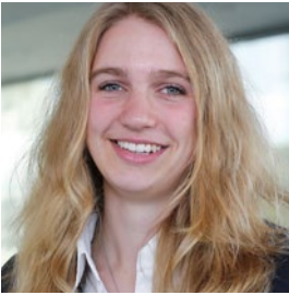
Alina Rüther Service & Consulting