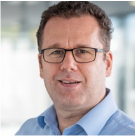
Kai Uwe Soppa Service & Consulting