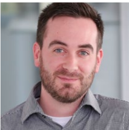
Malte Friedrich Service & Consulting