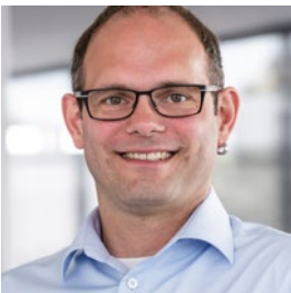
Andreas Koch Service & Consulting